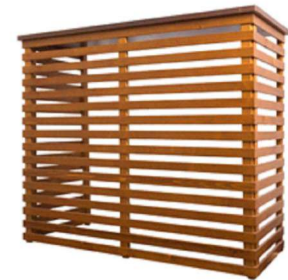
SISTEMA OCCULTAMENTO MACCHINA ESTERNA