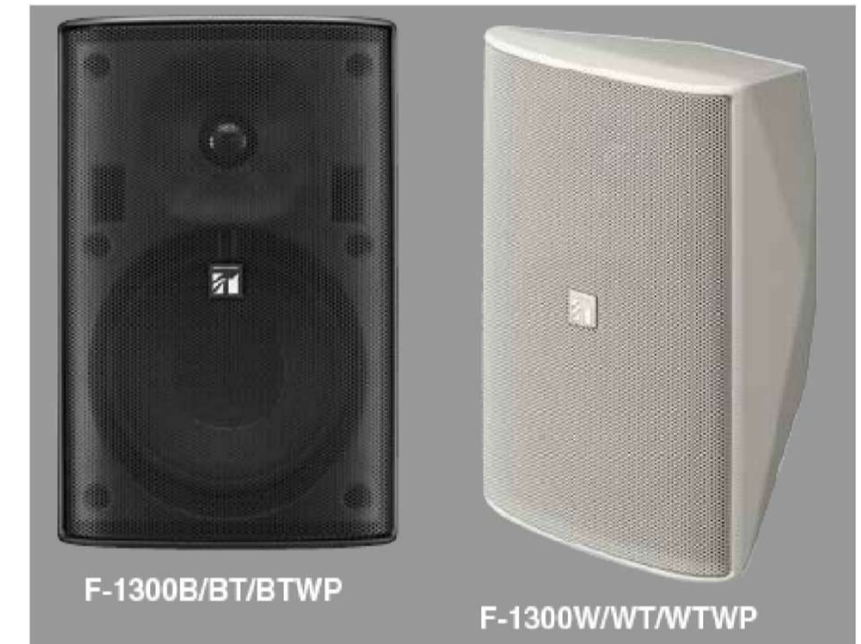
DIFFUSORI PER MONTAGGIO A PARETE TOA F1300WT