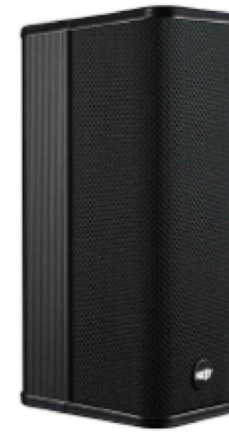
DIFFUSORE PER MONTAGGIO A PARETE NEXT M3