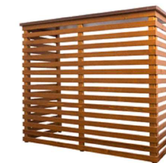
SISTEMA OCCULTAMENTO MACCHINA ESTERNA