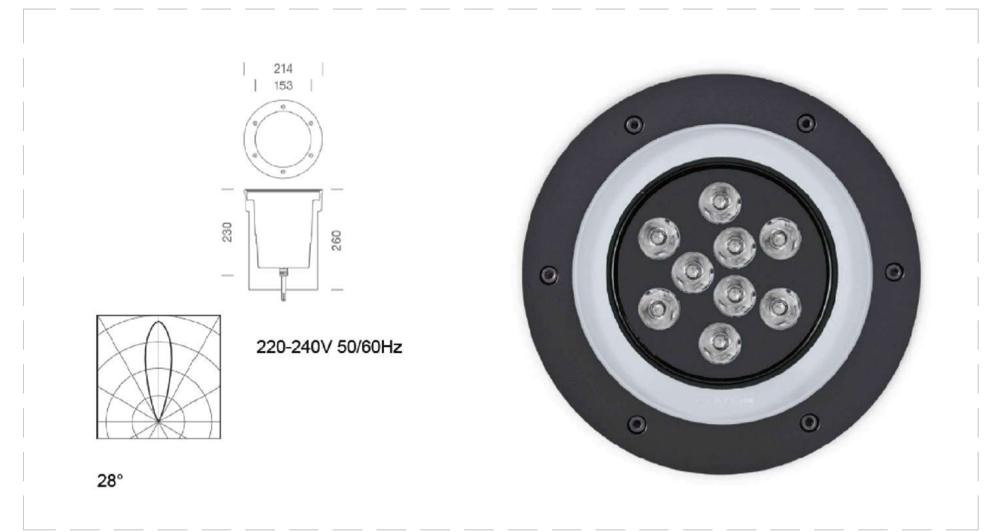
Corpo illuminante da installare